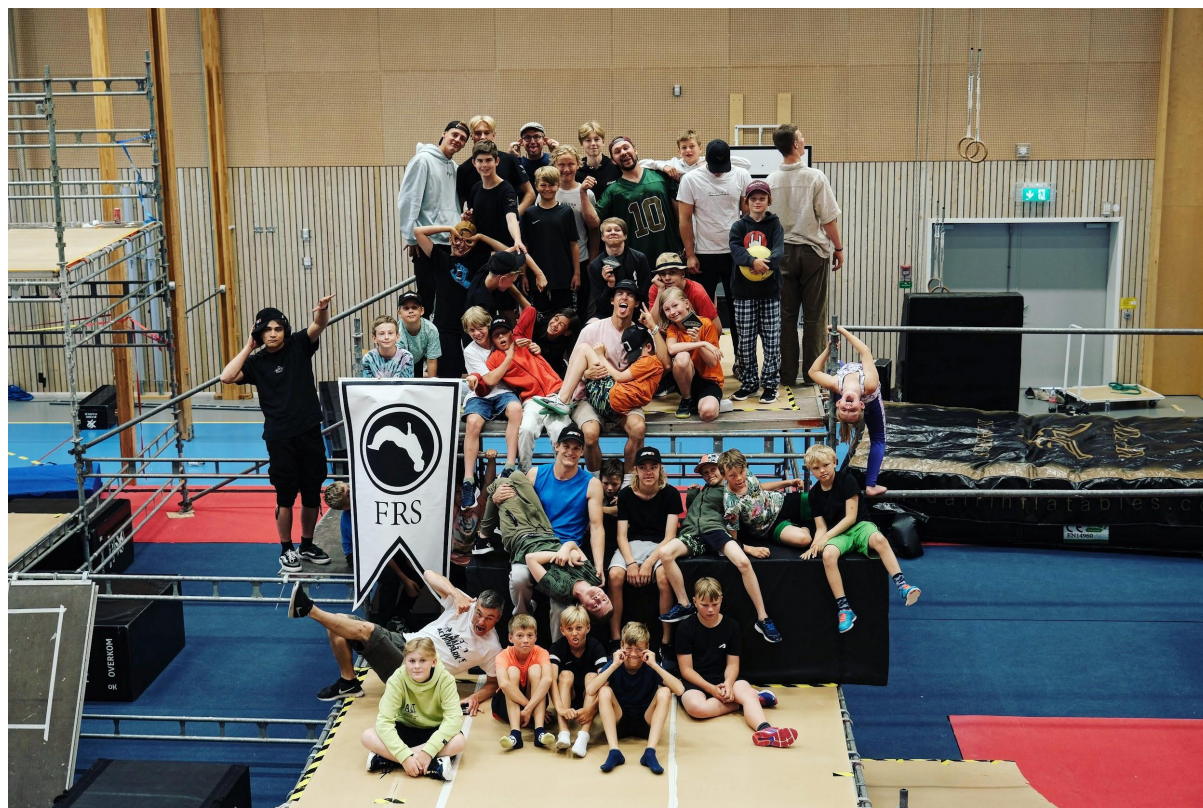
Aspera Summer Camp - 2022

Aspera Winter Camp kommer bli som Aspera Summer Camp fast ännu bättre! Vi är denna gången i våran egen hall på energigatan 23 i Kungsbacka där endast övernattnig sker på annan plats. Det kommer bli några riktigt roliga dagar för alla som vill träna, tävla och umgås med likasinnade! Bästa platsen för inspiration och lärande! Under evenemanget kommer vi också att bjuda in andra duktiga atleter runt om i Sverige!